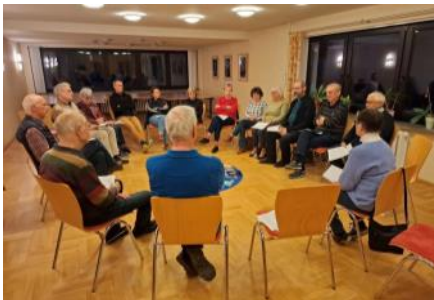
Pfarreiabend am 24.3. zum Thema „Schöpfungstheologie“