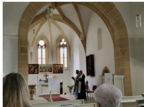
Am 10.5. fand die traditionelle Maiandacht in der evangelischen Kirche Hohendorf statt.