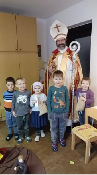
Nikolausbesuch während des Kleinkindertages