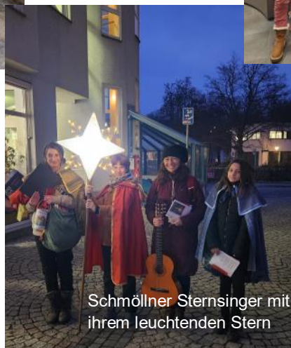
Schmöllner Sternsinger mit ihrem leuchtenden Stern