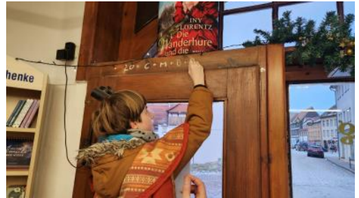
Schmöllner Sternsinger brachten den Segen in verschiedene Läden