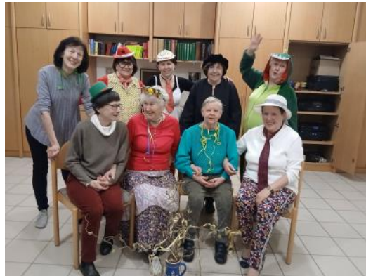
Faschingsfroher Abend in Rositz beim meditativen Tanzen