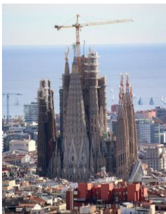
Sagrada Familia 2023