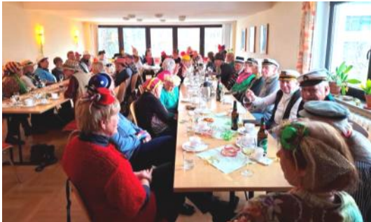
Hütchenfest der Gruppe 60+ am 4. Februar