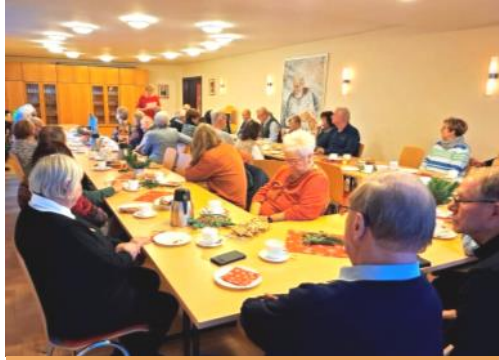
Adventsnachmittag der Gruppe 60+