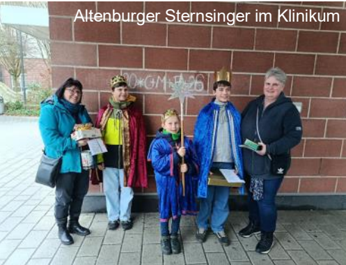
Altenburger Sternsinger im Klinikum

Gemeindepädagogische Helferin im evangelischen Kirchenkreis Altenburger Land