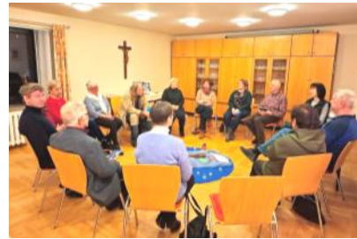
Exerziten im Alltag beim ersten Treffen am Aschermittwoch mit 15 Personen

Belebt durch Deinen Schöpferatem Ermutigst durch Deinen Sohn Jesus Christus Begleitet durch Deine Heilige Geistkraft